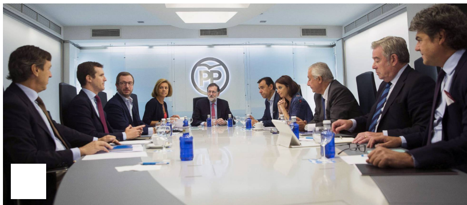
Mariano Rajoy preside este lunes la reunión de la dirección del PP.

Al entorno de Mariano Rajoy , y a él mismo, le llegan peticiones, sugerencias y requerimientos para que dé “un golpe en la mesa” frente al independentismo catalán. Pero el presidente ha preferido escuchar más a las palomas que a los halcones. “Cabeza fría”, receta a sus colaboradores Rajoy, que no caerá en acciones desmesuradas frente al independentismo, sino que hará valer la ley para impedir el referéndum con los menores costes posibles, según indican en su entorno. “Es muy frío, no le tiembla el pulso y ahora no piensa en lo que se pudo hacer en el pasado”, aseguran quienes trabajan con él a diario. EL PAÍS ha entrevistado a ministros, miembros de la dirección del PP y políticos de la oposición para radiografiar cómo afronta el presidente el reto del independentismo. Rajoy es consciente de que su presente y su futuro se escribirá en función de cómo acabe una de las mayores crisis de España desde el fin de la dictadura.